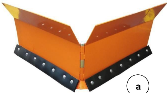
Abb. 1–2 In die Halterung des Universalträgers den Schneepflug platzieren ( a ) ihn mit Stiftverbindung, Schraube, zwei Unterlegscheiben und Flügelmutter befestigen, die im Zubehör des Universalträgers enthalten sind.

Schalten Sie den Trennschalter vor der Montage in die Position OFF.